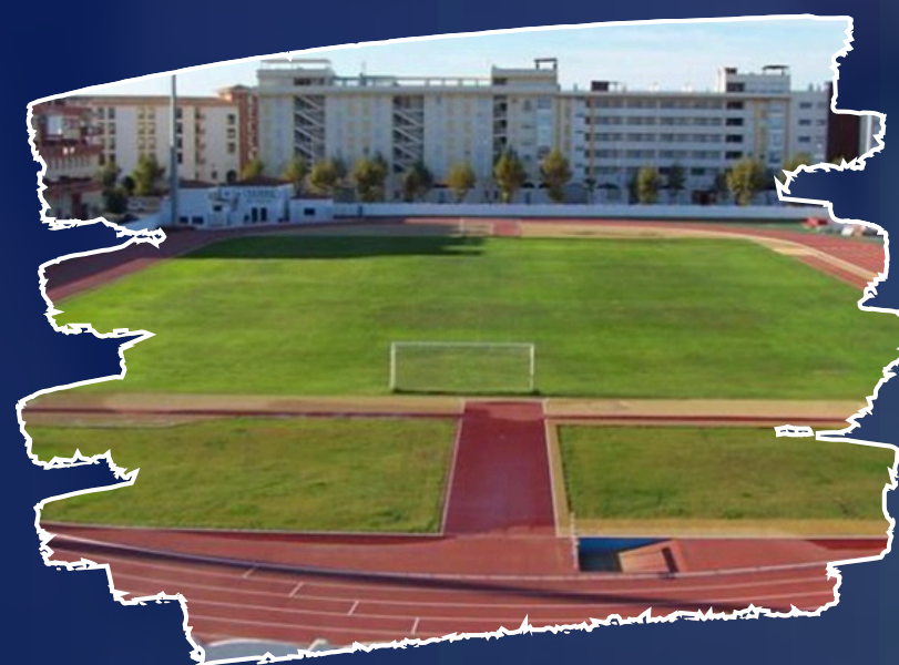
Campo Municipal de Isla Cristina. Césped natural.

Como en ediciones anteriores, contamos con 3 instalaciones perfectamente adaptadas para la realización de este torneo.