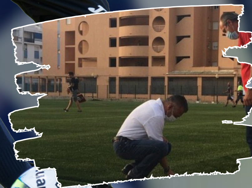
Campo Municipal Punta del Caimán. Césped artificial.