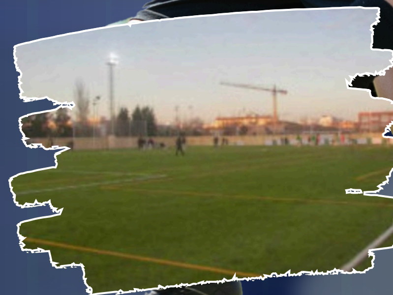
Complejo deportivo Emilio de los Santos, "El Candel". Césped artificial.